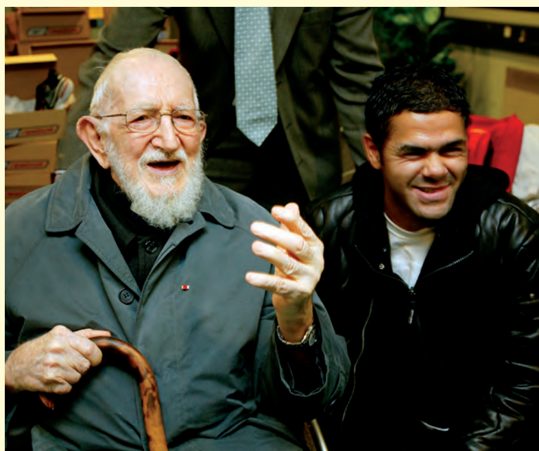
L'abbé Pierre et Jamel, le 8 mars 2004 à la Fondation.

moire. Sa nature, sa manière d'être en constante rébellion contre l'injustice, c'est ça qu'il faut rappeler. Son altruisme permanent, ce don de soi qu'il avait comme personne. C'est le dernier super-héros.