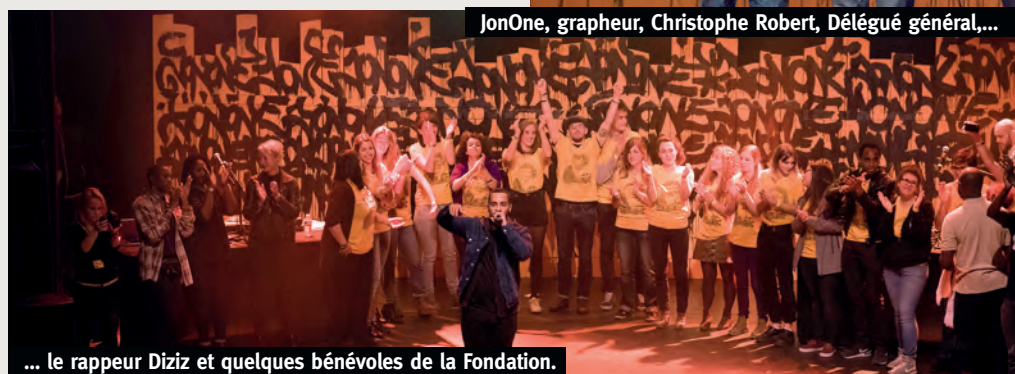
... le rappeur Disiz et quelques bénévoles de la Fondation.