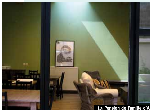
La Pension de Famille d'Alforville

service de la solidarité et permettre ainsi que le souhait de l'abbé Pierre d'un « emprunt fraternel pour le logement » devienne réalité.