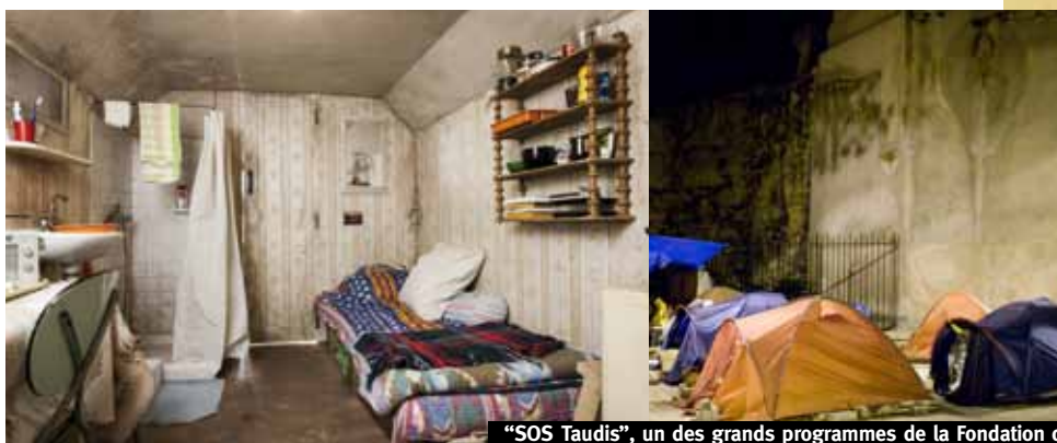
"SOS Taudis", un des grands programmes de la Fondation contre l'habitat indigne.