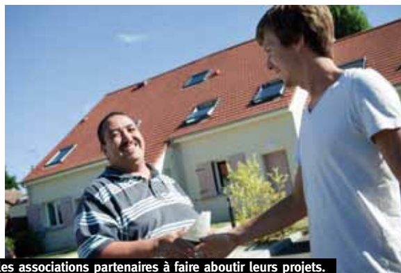
Aider les associations partenaires à faire aboutir leurs projets.

Durant l'exercice 2014, 9 projets ont pu être soutenus. La Fondation a créé une société d'investissements solidaires, SOLIFAP (lire en P. 1), dont elle est l'actionnaire fondateur, pour développer une aide spécifique aux associations en difficulté (réalisation de leur bilan financier, stratégie de changement) et dégager du foncier, etc.