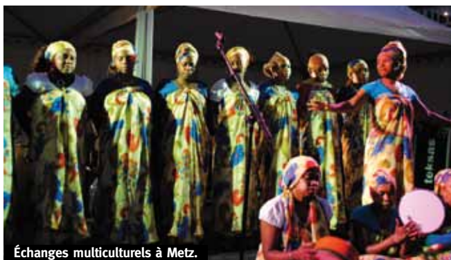
Échanges multiculturels à Metz.