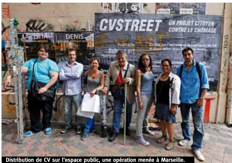
Distribution de CV sur l'espace public, une opération menée à Marseille.

La Fondation estime que "le vivre ensemble" contribue à l'amélioration de la vie quotidienne, tout autant que le logement. Elle soutient donc des projets qui permettent aux personnes des quartiers populaires de retrouver le pouvoir d'agir sur leur propre vie, ce qui valorise leurs parcours, les associe à des projets artistiques de qualité et suscite des liens entre les générations. Le secteur Promotion des habitants a soutenu et suivi 58 projets , dont près de 40% en Ile-de-France, 20% en PACA et en Rhône-Alpes.