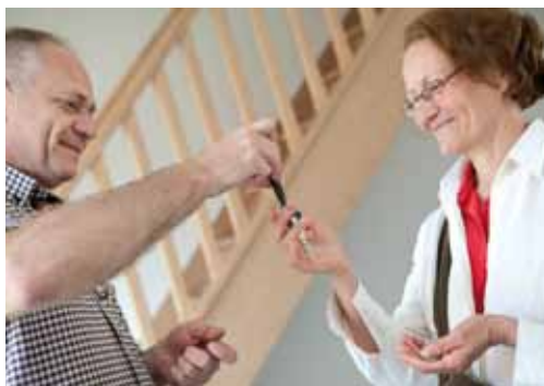
Remise de clés de logements très sociaux à Montreuil... ... et réhabilitation de "La Maison" à Saint-Genis-Laval (69).

5 projets de lutte contre la précarité énergétique ont été soutenus en 2014 qui a également été une année d'interpellation sur les politiques publiques menées pour mobiliser les ministères et les parlementaires autour de l'enjeu social de la loi de transition énergétique.