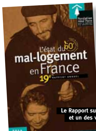
Le Rapport sur l'État du mal-logement et un des visuels de la campagne de sensibilisation.

La relation média, secteur important dans la médiatisation de la Fondation et de ses actions, a comptabilisé 1 385 alertes presse écrite, 4 294 alertes presse web et 677 alertes presse audiovisuelle. 94 communiqués de presse ont été publiés.