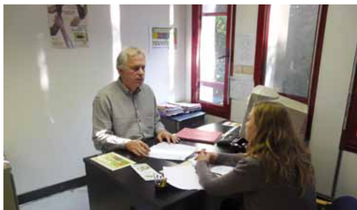
Accueil à la permanence de l'Espace Solidarité Habitat de la Fondation (Paris, 20 e ).

L'Agence Ile-de-France a soutenu 41 permanences d'accès aux droits (majoritairement dans le 93 et 94), animées par 13 associations. Elles ont accueilli 4 810 ménages en 2014. Enfin, 1 330 ménages ont été informés et orientés cette année par la plateforme " Allô Prévention Expulsion ".