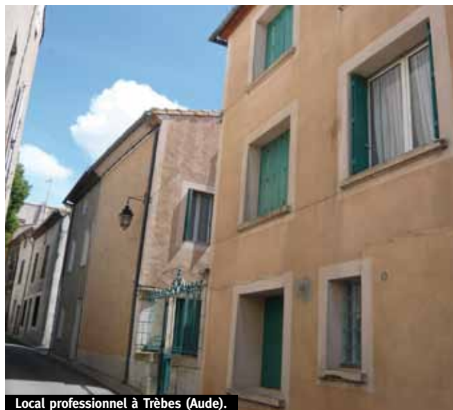
Local professionnel à Trèbes (Aude).

Le rôle du service de la Gestion du Patrimoine Immobilier, est de valoriser les biens immobiliers qui appartiennent à la Fondation. La GPI expertise, gère, loue, achète, vend, entretient un patrimoine immobilier diversifié qui génère une grande variété de sujets juridiques, financiers, urbanistiques... En 2014, la Fondation a recueilli 18 biens issus de legs et 3 issus de donations. 10 biens recueillis ont été vendus et un bail à réhabilitation a été signé au profit d'une association.