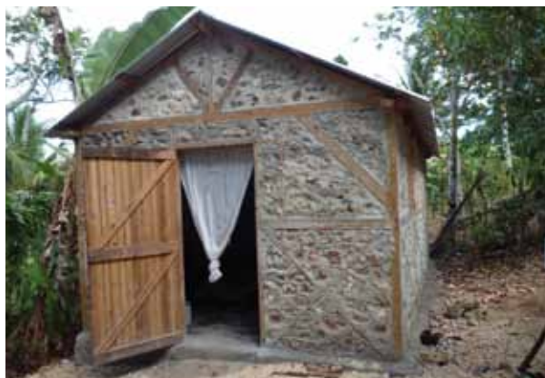
Niger, banque alimentaire animalière et Haïti, l'une des 60 maisons, deux réalisations financées avec l'aide de la Fondation.