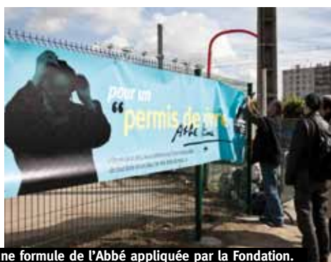
"Permis de vivre", une formule de l'Abbé appliquée par la Fondation.

Ces nouvelles conditions de vie ont considérablement changé la situation des adultes et des enfants: moins de soucis, moins de maladies, plus de concentration à l'école pour les enfants aujourd'hui tous scolarisés.